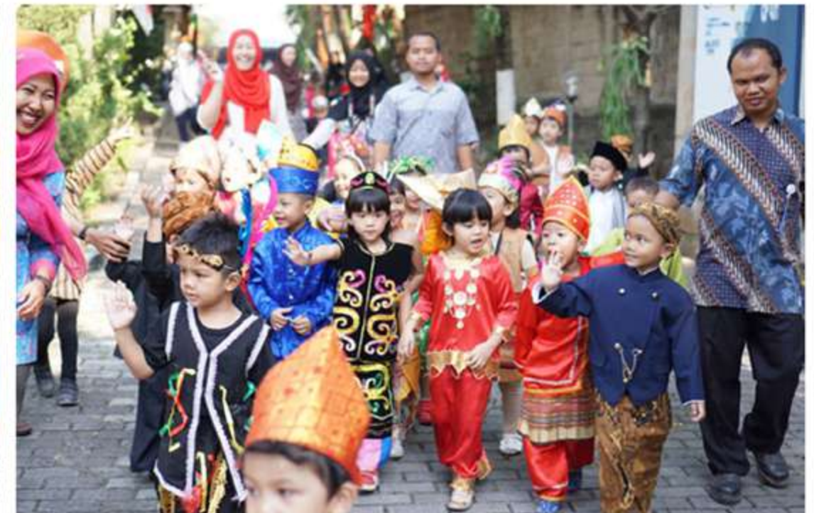
Independence Day Celebration