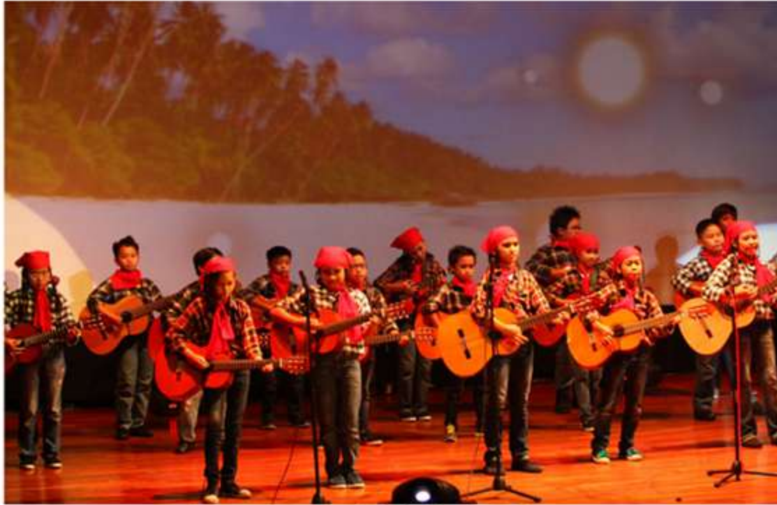
Pentas Akhir Tahun

Family Fun Day, Al-Fath Festival (Alfest), Independence Day Celebration, Book Week, Science Fair, Muharram Celebration, Isra Mi'Raj Olympiad, Math Olympiad, Manasik Haji, Pesantren Ramadhan, World Art Festival, Pentas Akhir Tahun, Pasar Sore Indonesia, dan lain-lain